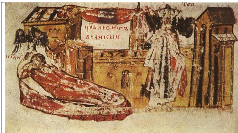
Императорите Лъв I (Цар Леонтъ Великий, вдясно) и Маркиан (легнал под орел вляво), Манасиева Хроника

Като ревностен християнин Лъв I Тракиец постановява, че само православни могат да заемат държавни и съдебни постове. Знае се, че той строи църкви (специално Богородица при Извора до Константинопол). Най-вероятно Малката базилика в Пловдив е строена по времето на Лъв I Тракиец (когато зет му Василиск е главен военен командир на провинция Тракия). Лъв I Тракиец получава много похвали и от неговия съвременник и съименник Св. папа Лъв Велики – човека, който заедно с един друг император от Балканите - Валентиниан III, спасяват Рим от войските на Атила. Лъв I Тракиец е последният император, за който е бил направен специален форум. В негова чест в Константинопол е била издигната и огромна колона с негова статуя.