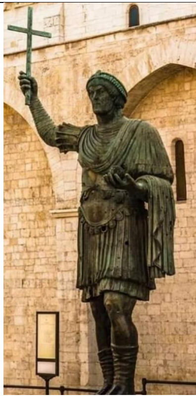
Колосът от Барлета – най-вероятно Лъв I Тракиец