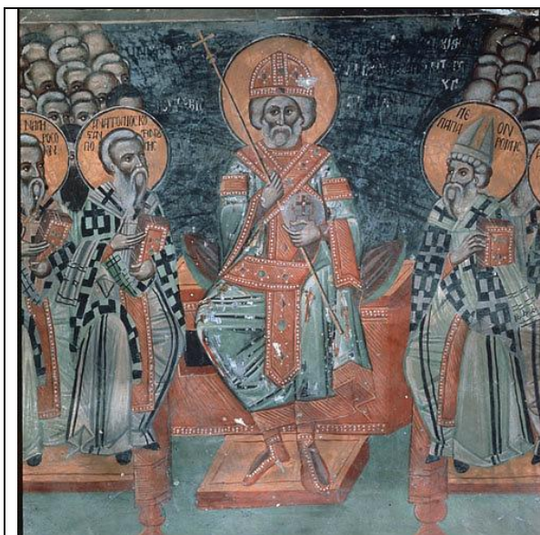
Св. Император Маркиан на Халкедонския събор, фреска 16 в., Църква Св.Созомен, Галата, Кипър

Архиепископ) и го поставя веднага след Римския папа. Последният се противопоставя на това решение и започват спорове, но през 452 г. Маркиан издава Имперски декрет за прекратяване на споровете и потвърждаване на Патриархалния трон на Константинопол. Първият Константинополски патриарх след този събор е Св. Анатолий I. По късно той извършва първата императорска коронация от духовен глава – по нареждане от Св. Император Лъв I Тракиец – традиция, която продължава и до сега при всички християнски монарси. Обаче поради гореспоменатите спорове Свети Маркиан (и Свети Лъв I Тракиец) са признати за Светци само от Православната църква, докато съпругата на Маркиан - императрицата Света Пулхерия е призната за Светица и от Православната църква и от Католическата църква.