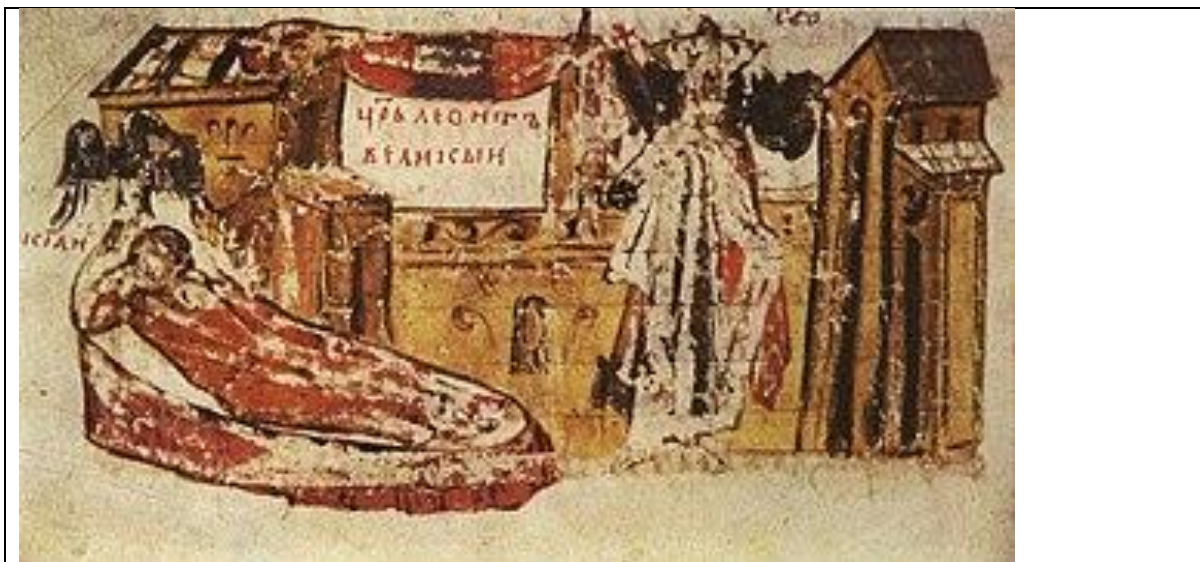
Маркиан на смъртното си ложе и Лъв I Тракиец (Царь Леонтъ Великий), Манасиева Хроника, 14 в.

Само от тази кратка статия, която събрах от много източници, е повече от ясно, че Маркиан е бил една изключителна историческа личност. Ние може само да се гордеем с този император, свързан и с Пловдив, и със страната ни. И ако още не сме му направили паметник в Пловдив, нека поне да се сещаме за него когато ходим по римските улици в древния ни град, особено по пътя през Източната порта и през Форума, където със сигурност той лично е минавал многократно.