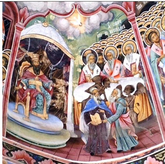
Император Маркиан изслушва споровете на Халкедонския събор, фреска от Рилски манастир, 19 в.

Едно от най-великите дела на император Маркиан е свикването и председателстването му, заедно с императрица Пулхерия, на Халкедонския Църковен Събор през 451 г. На този Вселенски събор се оборват редица ереси и се формулира един от най-важните стълбове на християнството – за Богочовешката същност на Христос. За този Събор и за чудесата свързани със Свети Император Маркиан ще пиша в следващата статия. Обаче тук ще спомена само, че отците на Събора, събрани от целия Християнски свят, го наричат „Втория Константин Велики“.