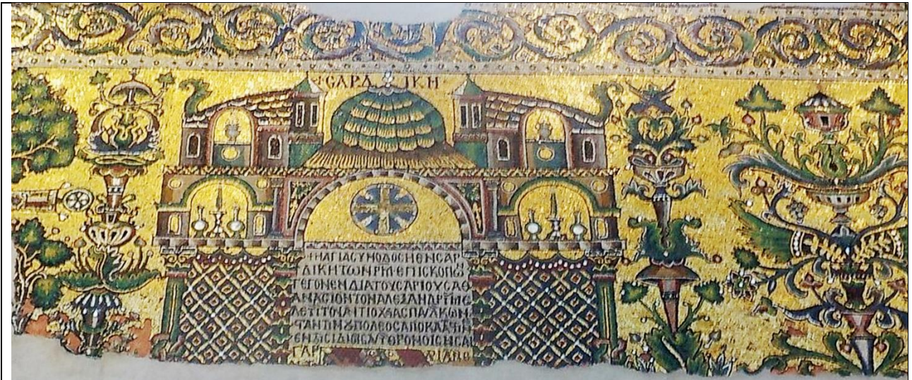
Фиг.3 Изображението на Събора в Сердика, стенна мозайка (детайл), 12 век, църква „Рождество Христово“, Витлеем

Тази изключителна църква има още една връзка с България. Стенните ѝ мозайки от 12 век, правени по времето на кръстоносните походи, изобразяват местата на специалните събори на Христовата църква. Едно от тези изображения на църква има надпис Сардика (Сердика, София), акцентирайки на Сердикийския Събор (Фиг.3) от 342-343 г. Отляво на Сердика има изображение на Антиохия.