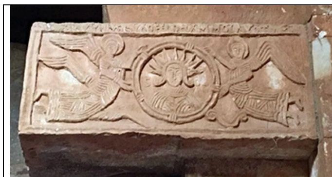
Фиг.1 Ангели поддържат емблема с Христос като Непобедимото слънце, каменен фриз, 7 век, Santa María de Quintanilla de las Viñas, Испания

Вероятно този култ е бил почитан и от новопокръстените християни, които изобразявали на места Христос с корона от лъчи. Такава мозайка има в една от катакомбите под Ватикана, а в малката църква на визиготите в Испания има такъв барелеф на Христос, поддържан от ангели (Фиг.1). Вероятно много от почитателите на Митра са станали християни, защото върху някои от техните храмове по-късно са строили църкви (например църквата Сан Клементе в Рим, където е гробницата на Свети Кирил).