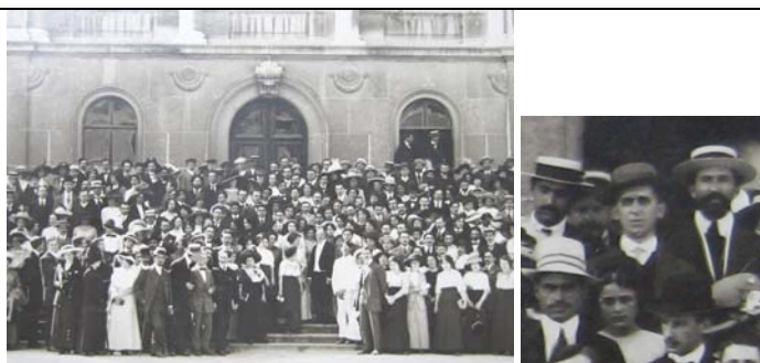
Женевски Университет, Дипломиране на випуск 1915