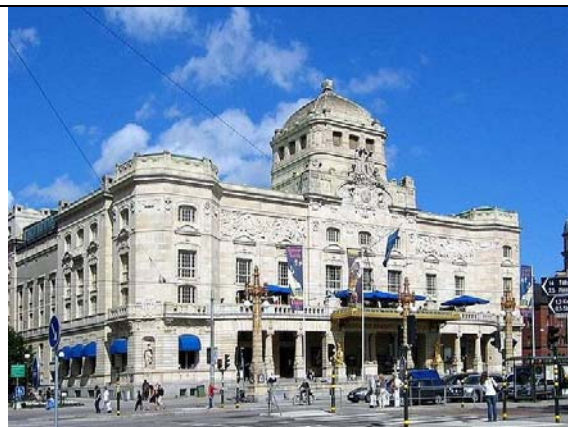
Кралският театър в Стокхолм (сградата от 1908)

Ако погледнем архитектурно и сравним новата сграда на театъра в Стокхолм, строена през 1908 г., с театъра в Русе, строен десет години по-рано (в 1898 г), не бихме казали че нашият театър отстъпва. Една от невидимите разлики е процентът от прихода на Стокхолм даден за тази постройка, сравнен с процента от прихода на Русе. Зад тази огромна разлика обаче стои възделението на русенлии, което е сигурно толкова пъти в повече в полза на България. Бай-Ганювци има навсякъде по света, но такива хора не могат да желаят подобна сграда и духовен възход. Невероятното поколение на нашите деди и прадеди е постигнало това благодарение на волята и мечтите си. Едно поколение, което е можело да мечтае нависоко, независимо от трудните времена, в които е живеело.