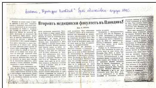
Статията във вестник „Културен Пловдив“ (януари, 1945)

Медицински Факултет в Пловдив – старата му мечта. Така в началото на 1945 г. той пише статията си „Вторият медицински факултет в Пловдив“ във вестник „Културен Пловдив“.