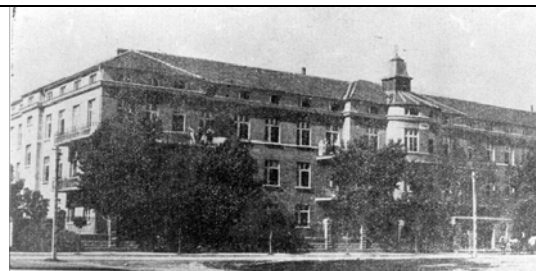
Католическа Болница Пловдив през 1938 (предна част както е в момента като Военна Болница)