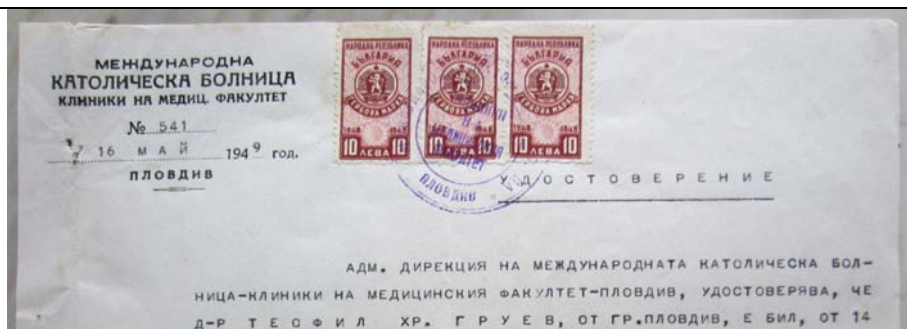
Бланка на Католическа Болница – Клиники на Медицински Факултет Пловдив, 1949