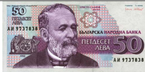
Българска банкнота от 50 лева (с Христо Г. Данов, 1991)

След 2 години той събира свои средства и с допълнителната финансова помощ от баща си заминава да учи фармация в Женева. Фармацията тогава се е завършвала за по-кратко време и това е бил финансово възможният вариант. Все пак тогава 1 златен български лев е равен на 1 златен швейцарски франк. За кратко време Теофил завършва фармацията и през 1907 г. се завръща в България като магистър-фармацевт. Започва работа в Асеновград и скоро се оженва за Невена Савова от Панагюрище – сестра на приятеля му от гимназията и от следването Пенчо Савов. През 1908 г. се ражда дъщеря им Радка. Теофил редовно пътува до Пловдив за да се подготвя в Библиотеката за следващото си следване в Швейцария. За две години Теофил е събрал достатъчно средства, за да се завърне в Женева и да учи медицина. По това време Медицинският факултет на Женевския университет е сравнително млад и е един от най-добре оборудваните в Европа.