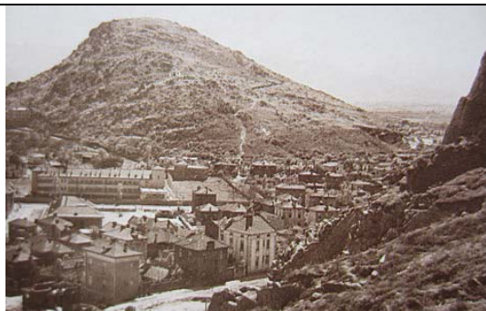
Държавната болница Пловдив, 1924 (на същото място като в момента)

Всичко това той постига на базата на един много труден период за България – страната е след голяма катастрофа, бежанци се стичат не само от Тракия и Македония, но и от Арменския геноцид в Турция. Септемврийското въстание още повече усложнява обстановката. Едни от основните категории в страната са несигурността и невъзможността да се види бъдещето. Но както много други хора д-р Груев не се отчайва – новаторският му дух непрекъснато търси прогреса и така през 1925 г. той отива за 6 месеца да специализира рентгенология в Париж. Тук слуша лекциите на Пруст, Сержан и Лиан, както и на Мария Кюри.