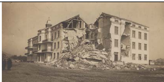
Католическа Болница Пловдив след земетресението през 1928