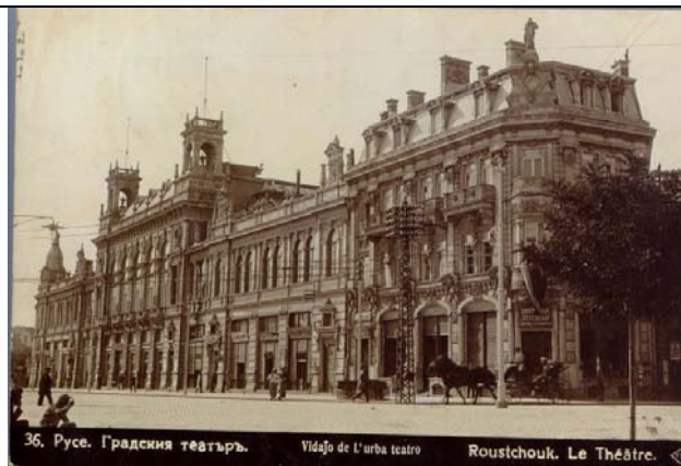
Градският театър в Русе (сградата от 1898)

Днес ще говоря за един от тези достойни българи и неговото място в Пловдив и България, като съм сигурен, че много от присъстващите са свързани генетично с подобни градители на нова България.