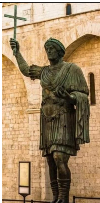
Колосът от Барлета – 5м статуя от бронз, много вероятно на император Лъв I Тракиец