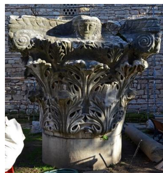
Горна част от колона най-вероятно на Лъв I Тракиец (в двора на Топкапъ)