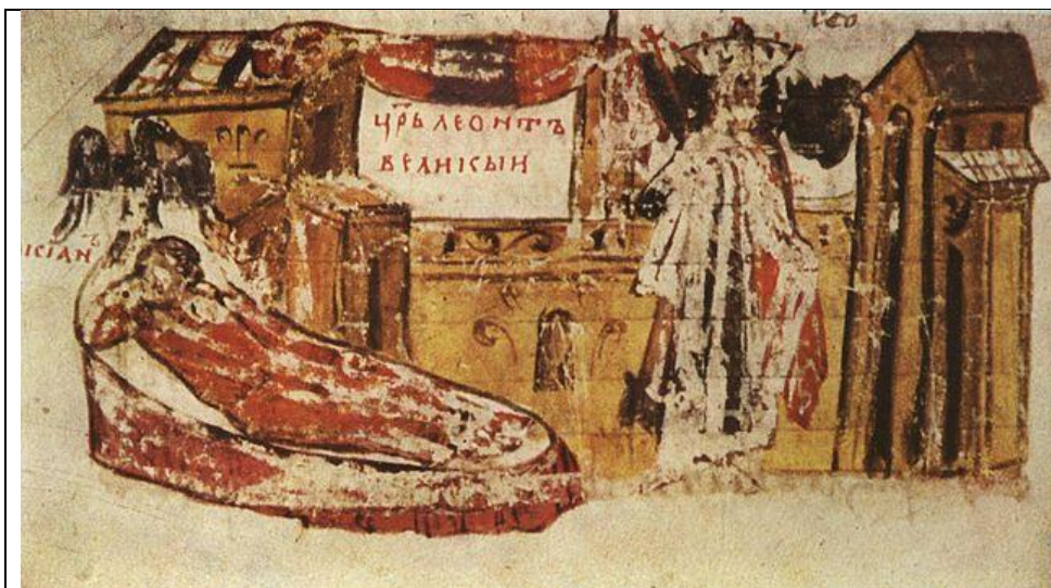
Императорите Лъв I (Църъ Леонтъ Великий, вдясно) и Маркиан (легнал под орел вляво), Манасиева Летопис, Ватикански препис

Като ревностен християнин Лъв I Тракиец постановява, че само православни могат да заемат държавни и съдебни постове. Също по негово време със закон е забранено търгуването и всяка работа в неделя, за да могат християните да ходят на служба. Знае се, че той строи много църкви (специално Богородица при Извора до Константинопол). Най-вероятно Малката базилика в Пловдив е строена по времето на Лъв I Тракиец (когато зет му Василиск е главен военен командир на провинция Тракия). Лъв I Тракиец получава много похвали и от неговия съвременник и съименник Св. папа Лъв Велики – човека, който заедно с един друг император от Балканите - Валентиниан III, спасяват Рим от войските на Атила. Лъв I Тракиец е последният император, за който е бил направен специален форум. В негова чест в Константинопол е била издигната и огромна колона с негова статуя, а в стените на града е имало и негов монумент.