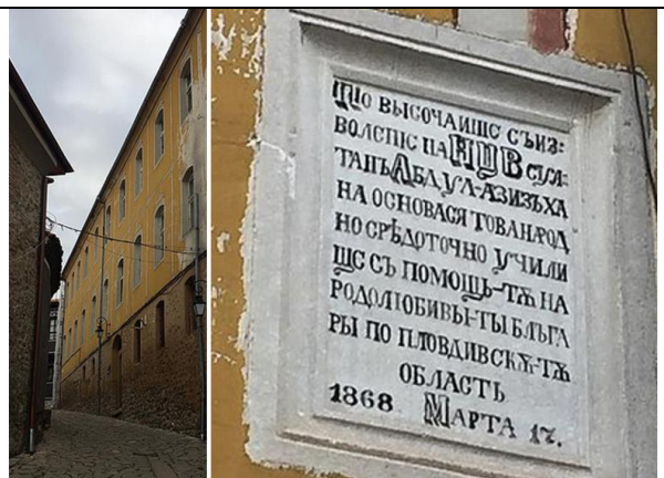
Фиг. 2 В тази сграда (Жълтото училище) в Стария Пловдив се премества през 1868 Найден Геровото училище „Св.Св. Кирил и Методий“. Тук то се помещава от 1868 до 1885 и през това време получава статут на Гимназия (първата Българска гимназия) – на фигурата отляво училището в Стария Пловдив (сега ул. „Тодор Самодумов“); отдясно – плаката на сградата.