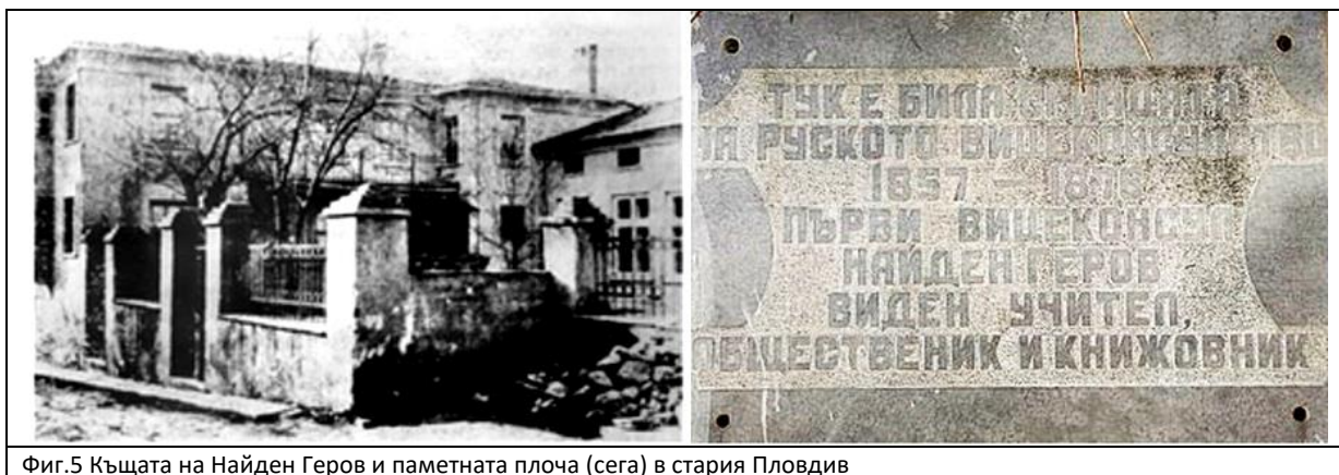
Фиг.5 Къщата на Найден Геров и паметната плоча (сега) в стария Пловдив

Речникът на Найден Геров е първият основен източник за езика ни от онова време, издаден е в Пловдив (първият том през 1895). В том 4-ти има много интересна дума - ПЛОВДИН, която Геров посочва като синоним на ПЛОВДИВ (наистина има много наши топоними завършващи с ИН). Той подкрепя това „друго“ име на града от онова време с народна песен за Пловдивските момичета, като използва за тях думата „Пловдинка“ – Фиг.6. (в Интернет песента е дадена като песен от Пиротско).